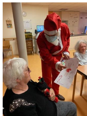
Remise par l'équipe de l'EHPAD Abrapa de Holtzheim des créations du Périscolaire d'Holtzheim