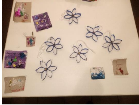
Créations du Péri scolaire Blienschwiller pour les résidents de l'EHPAD d'Epfig