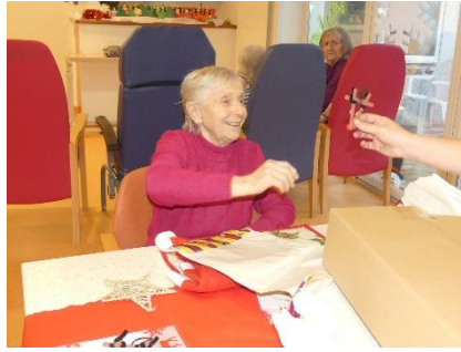
Remise par l'équipe de l'EHPAD « Des jardins d'Emeraude de Bischwiller » des créations du Péricolaire de Rohrwiller