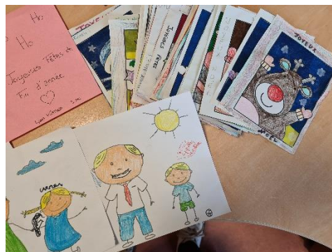
Créations du Péricolaire de Roeschwoog pour les résidents de l'EHPAD L'Orée du Bois de Soufflenheim