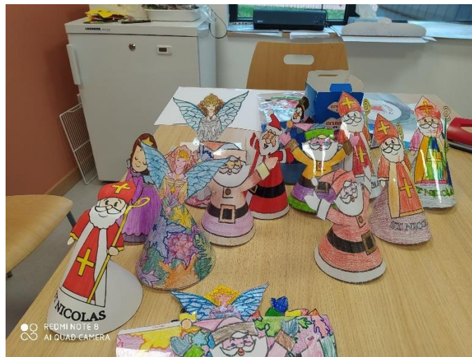
Décorations préparées par le péri scolaire d'Elsenheim pour l'EHPAD Résidence Le Ried de Marckolsheim