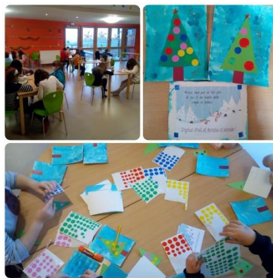
Créations du Péricolaire d'Ingwiller pour les résidents de l'EHPAD du Neuenberg à Ingwiller