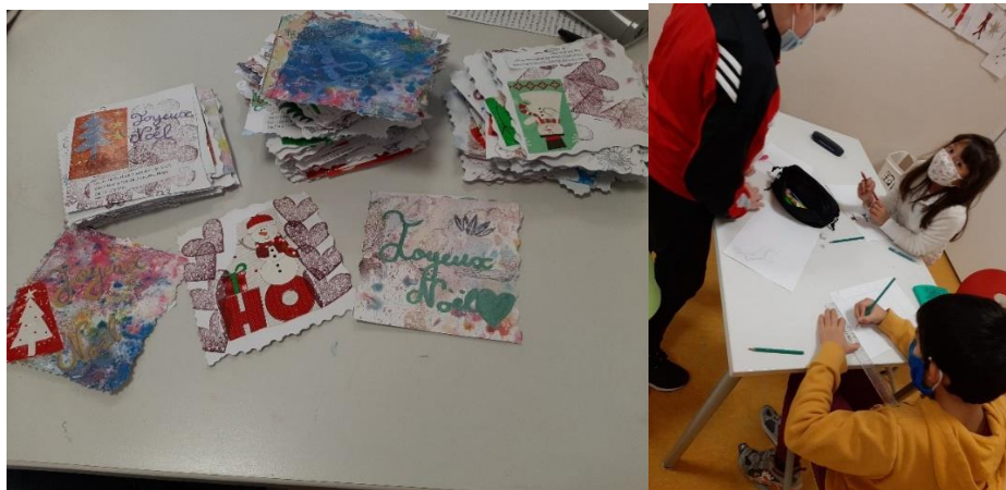
Les enfants du périscolaire de Valff en train de réaliser 150 cartes pour qu'elles soient distribuées en collaboration avec la Mairie aux aînés de la commune.